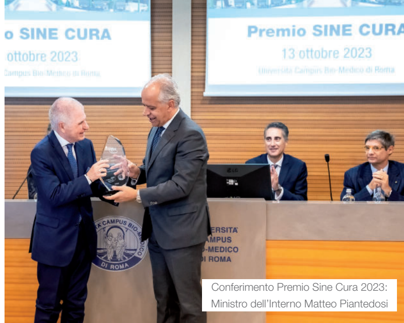
Conferimento Premio Sine Cura 2023: Ministro dell'Interno Matteo Piantedosi

Per i professionisti già occupati nel settore della sicurezza, il Master offre l'opportunità per arricchire il proprio Curriculum, ampliare il network di conoscenze in un settore in grande espansione e l'occasione per una crescita lavorativa e un avanzamento di carriera.