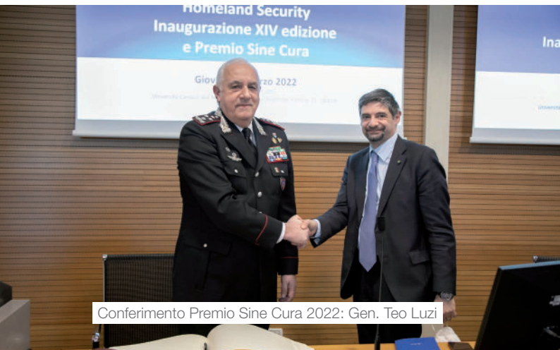
Conferimento Premio Sine Cura 2022: Gen. Teo Luzi