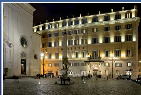
Grand Hotel De la Minerve - Roma