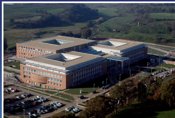
Università Campus Bio-Medico di Roma Policlinico Universitario